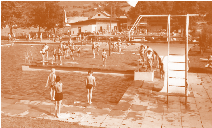
Bereits in seiner ersten Badesaison erfreute sich das Schwimmbad Vorderland großer Beliebtheit.