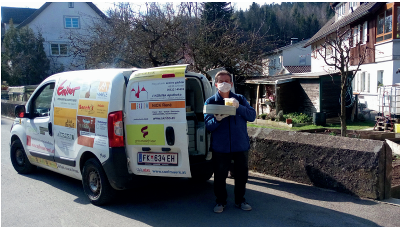
Essen auf Rädern: Wichtige soziale Dienstleistungen wurden unter strengen Hygienemaßnahmen aufrecht erhalten.