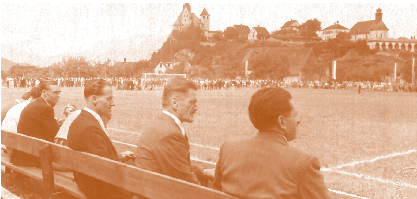
Sehnsucht nach Normalität: (oben und unten links) Eröffnung des Sportplatz Gastra, 1949; (unten rechts) Musikausflug mit einem Barbisch-Omnibus, um 1954