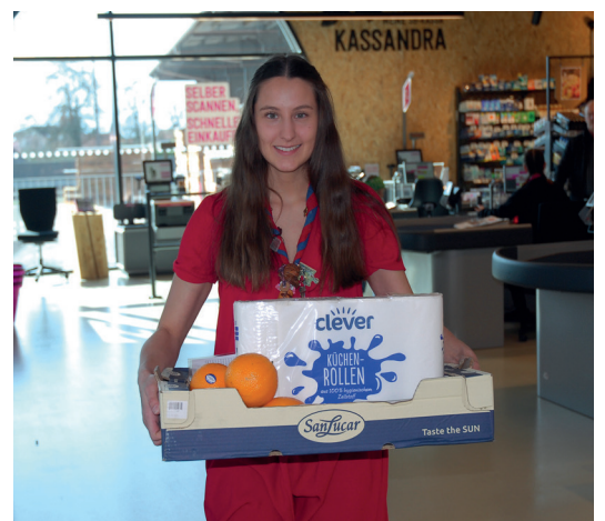
Lebensmittelservice: Gemeinsam mit den Pfadfindern hat die Marktgemeinde einen Lieferservice für Lebensmittel und Medikamente auf die Beine gestellt.

Neues aus Rankweil direkt in Ihr Postfach. Melden Sie sich jetzt an.