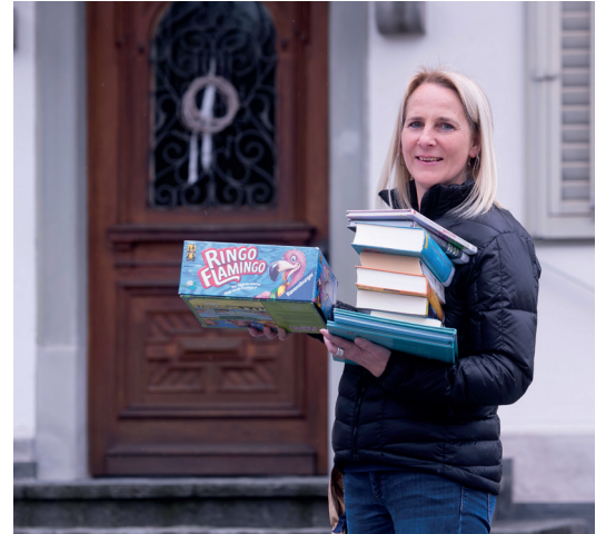
Bibliothek-Service: Dank einem Zustellservice kamen Lesebegeisterte trotz geschlossener Bibliothek auf ihre Kosten.