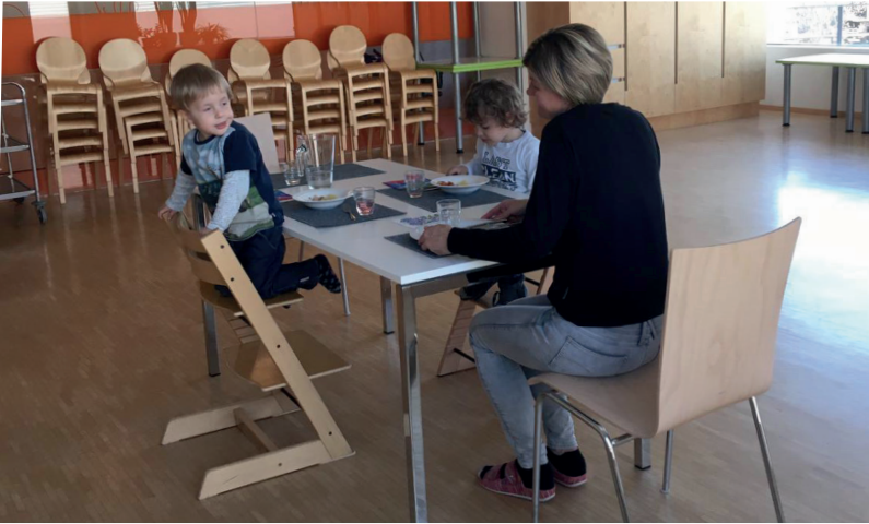
Kinderbetreuung: Ein ungewöhntes Bild bot sich in den Kindergärten. Bei Bedarf war die Kinderbetreuung gewährleistet, nur wenige nahmen diese in Anspruch.