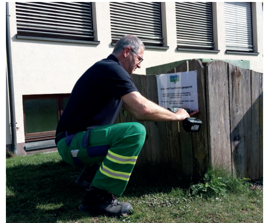
Ausgangsbeschränkung: Mitarbeiter des Bauhofs sperrten sämtliche Sport- und Spielplätze sowie Freizeitanlagen.