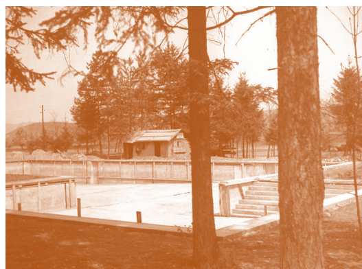
Anfang Mai 1955 war das Schwimmbecken so gut wie fertiggestellt.