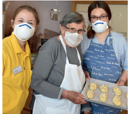
Senioren: Die Besuchs- und Ausgangsbeschränkungen sowie die Gestaltung eines möglichst normalen Alltags waren im Pflegebereich eine große Herausforderung.