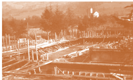
Eindruckliche Schalungstechnik der damaligen Zeit. Im Hintergrund die Sulner Pfarrkirche zum Heiligen Georg.