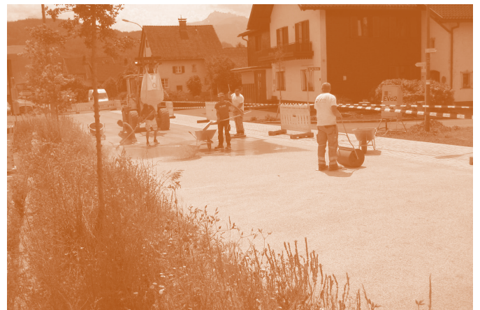
So sah die Straße noch bis vor Kurzem aus (l.). Inzwischen sind die Bauarbeiten beendet (r.).

rendes Unternehmen war die Firma Wilhelm und Mayer aus Götzis, die Planung erfolgte über das Verkehrsplanungsbüro Besch & Partner. Die Bauleitung wurde vom Ingenieurbüro M+G Ingenieure aus Feldkirch durchgeführt. All diese Unternehmen haben auch den Bahnhofsvorplatz an der Bahnhofstraße errichtet, wodurch mittels eines Anhängeangebots auf eine Ausschreibung verzichtet werden konnte.