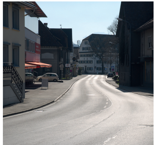
Ringstraße: Wo täglich normalerweise rund 17.000 Fahrzeuge fahren, herrschte plötzlich gespenstische Stille.