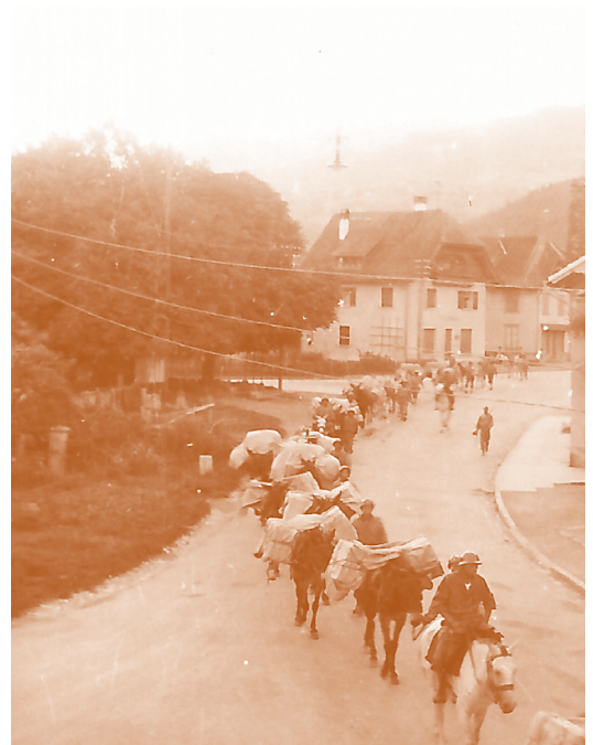
Die Fotos oben rechts zeigen den Einmarsch der französischen Armee am 3. Mai 1945, die beiden unteren den Abzug der „Mulikompanie“ am 18. Mai 1946. -