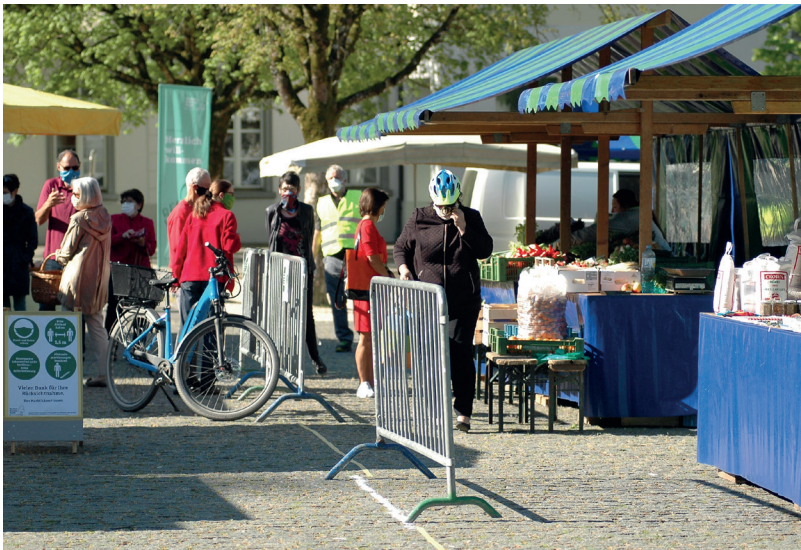
Rankler Wochenmarkt: Mitte April fand der Wochenmarkt erstmals nach der coronabedingten Pause wieder statt – selbstverständlich unter strengen Sicherheitsvorkehrungen.