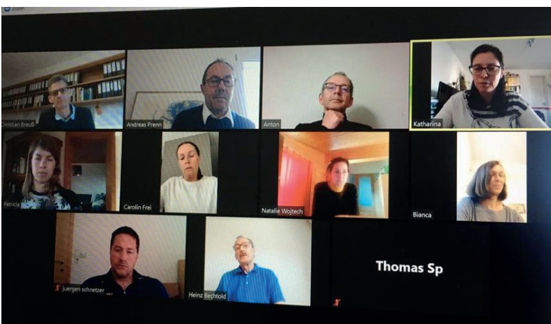
Home Office: Der Krisenstab der Marktgemeinde stimmte sich einmal täglich per Videokonferenz ab. Viele MitarbeiterInnen waren zudem laufend vom Home Office aus tätig.