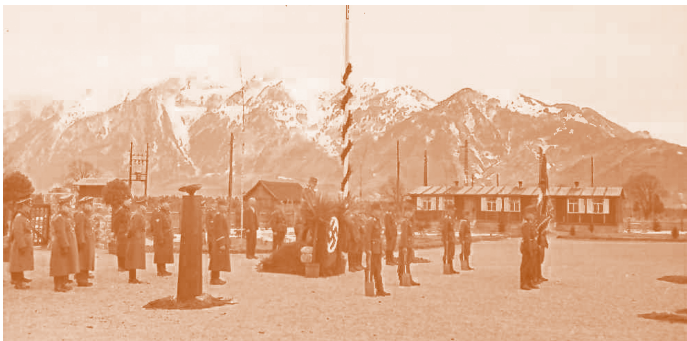
Anhaltelager Brederis, ehemaliges Reichsarbeitsdienstlager auf dem Gelände der heutigen Kunert, zwischen 1943-1945.

Die Erzählungen der Personen sollen möglichst vielseitige Einblicke in die Rankweiler Geschichte geben.