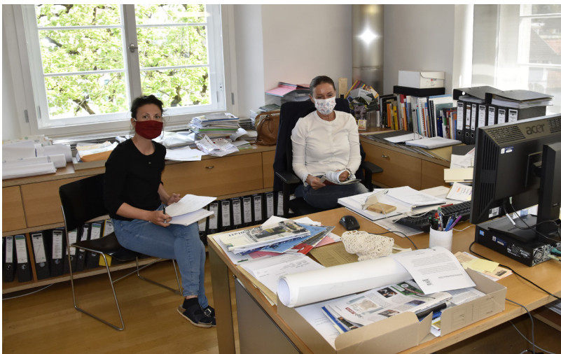
Büroalltag: Die neue Normalität im Rathaus Rankweil.