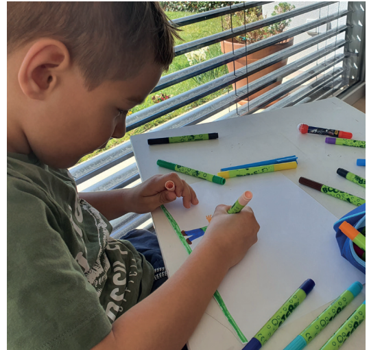
Malwettbewerb: Gemeinsam mit der Druckerei Thurnher hat die Marktgemeinde Rankweil einen Malwettbewerb für Kinder ins Leben gerufen. Thema: Auf was ich mich nach Corona am meisten freue.