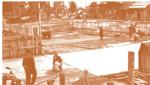
Im Frühjahr 1954 wurde mit dem Bau des Schwimmbades begonnen.

Die Badeanlage erfreute sich – auch ohne den nicht zu realisierenden Campingplatz – rasch eines breiten Zuspruchs. 1959 wurden bereits über 22.000 Badegäste gezählt. Nach der groß angelegten Erweiterung zu einem Erlebnisbad mit mehreren Attraktionen im Jahre 1993 stieg diese Zahl auf durchschnittlich rund 45.000 BesucherInnen pro Jahr, mit Spitzen bis weit über 56.000 Badegäste.