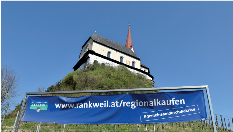
Unterstützung der Wirtschaft: Viele Unternehmen und Gastronomiebetriebe haben auf Liefer- oder Abholdienste umgestellt. Die neuen Vertriebskanäle wurden vom Gemeindemarketing auf eine digitale Plattform zusammengefasst und beworben.