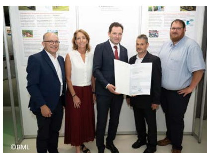
Anerkennung LEADER in Wien