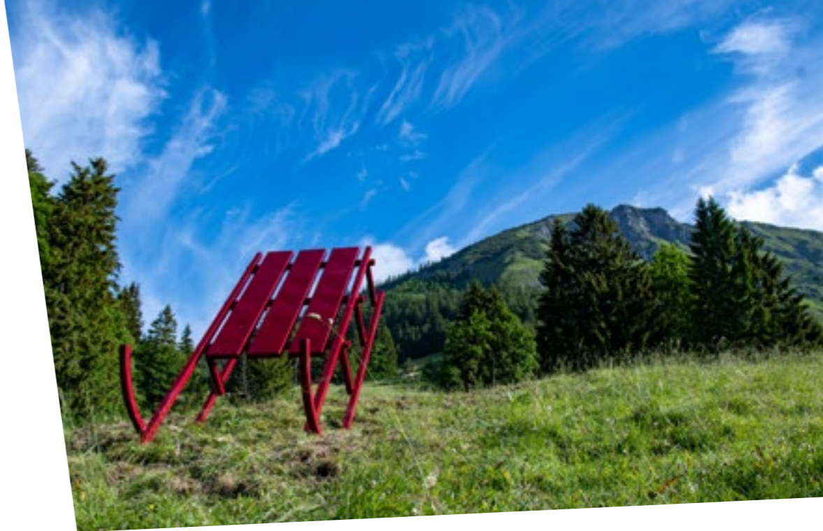
Der Kunstwanderweg „Alpine Art“ am Muttersberg.