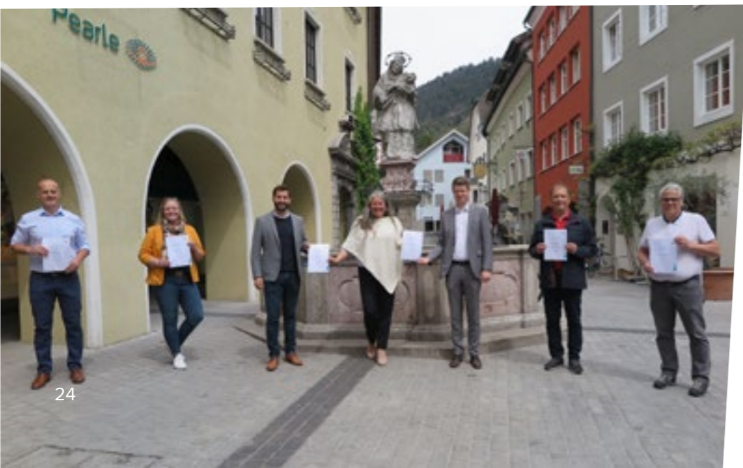
Offizielle Übergabe der MINT-Urkunde im Mai.